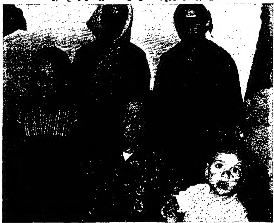
هؤلاء الأطفال الأبرياء ... فحياهم أعمالهم كعب عليهم ان يترجموا في السجن !